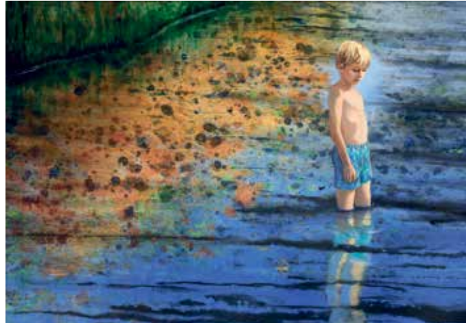
Gemälde in Wasserfarben von Gerhard Knell

das Aufzeigen innerer Zusammenhänge.“ Die Ausstellung „Innere Landschaft“ ist ab dem 14. September 2024 in den Räumlichkeiten von EM Chiemgau zu entdecken und gibt einen tiefen Einblick in die künstlerische Welt von Gerhard Knell, in der die Natur nicht nur als äußeres Phänomen, sondern als inneres Erlebnis dargestellt wird. Neben den großformatigen Acrylgemälden bietet die Ausstellung auch Einblicke in die Skizzenbücher des Künstlers, die seine Experimentierfreude und Fantasie eindrucksvoll dokumentieren. Von Montag bis Freitag von 9 bis 18 Uhr und am Samstag von 9 bis 12 Uhr können die Bilder bestaunt werden.