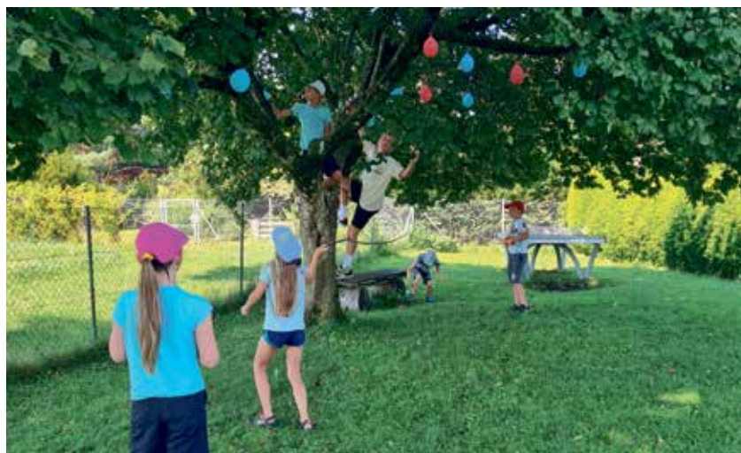
„Dirtpark am Samerberg und Skateboardkurs“ (Sportverein Schloßber-Stephanskirchen)