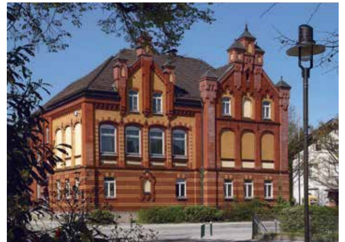
Das „Rote Schulhaus“ ist am 14. August exakt 125 Jahre alt geworden.